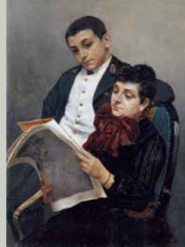
La esposa y el hijo del pintor , 1886 Museo de Bellas Artes de València

Ara, a penes un any després del centenari de la seua mort, és el moment de recuperar l'artista oriolà, per a mostrar-lo des de les diferents disciplines artístiques que va treballar al llarg de la seua dilatada vida.