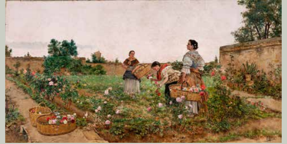
Mujer cogiendo flores , 1895. Museo de Bellas Artes de Bilbao