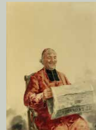
Cardenal leyendo , ca. 1870