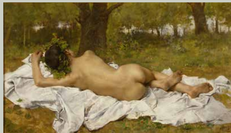
Baco joven , 1872 Museo de Bellas Artes de València