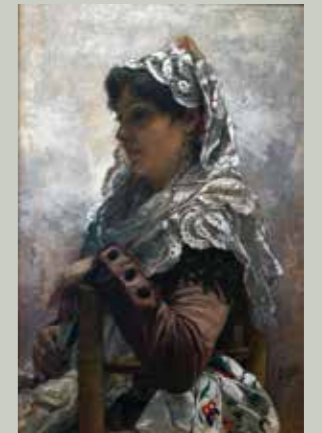
Valenciana con mantilla o Retrato de valenciana , ca. 1886 Museo Nacional de Cerámica "González Martí"