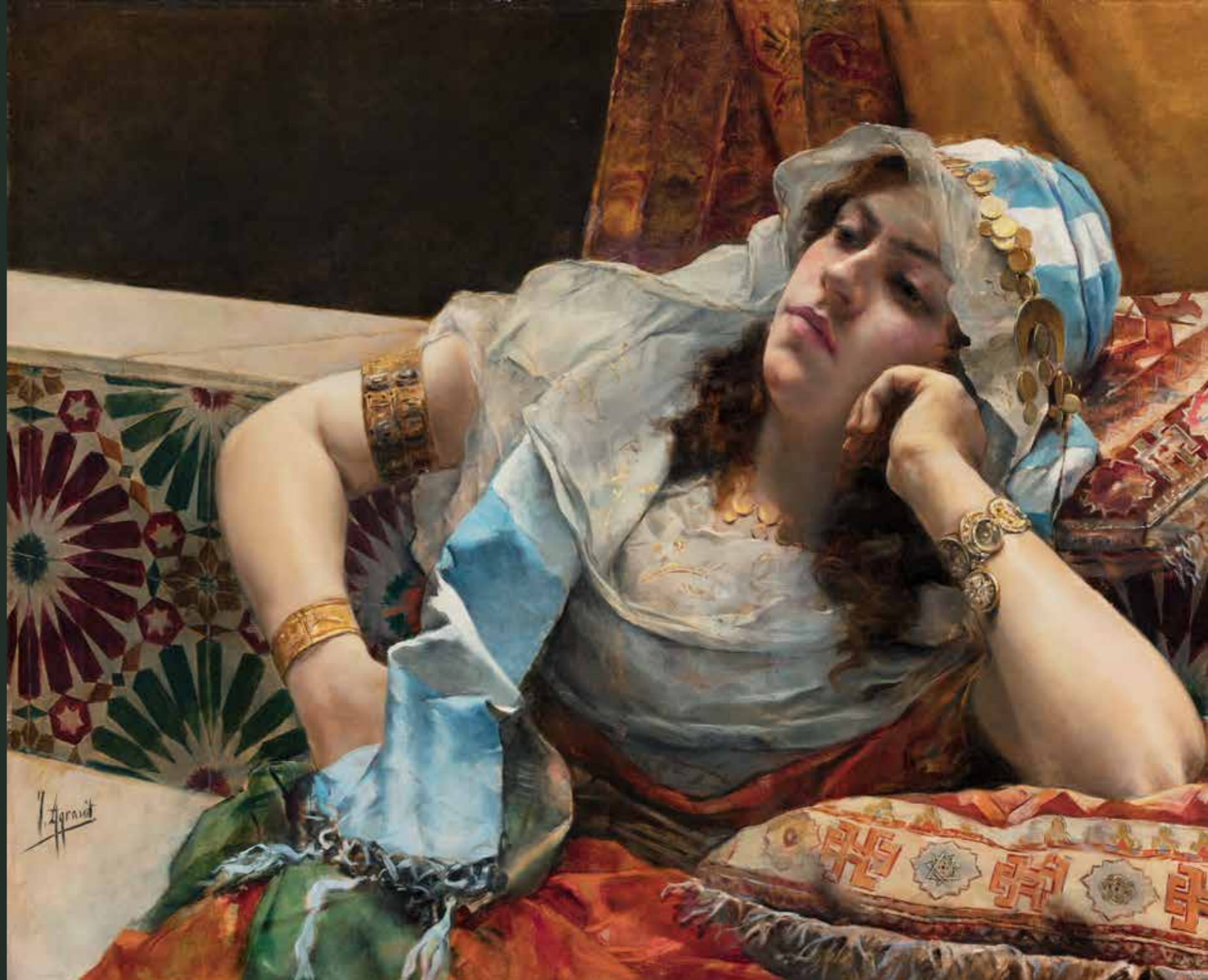
Odalisca , 1890-1910 Col. particular

Dimarts a diumenge / Martes a domingo: 10:00 - 20:00 h